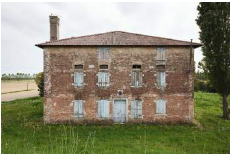
Il tetto in amianto della Barchessa di Ca' Cottoni, prima dell'intervento dell'artista The asbestos roof of the Barchessa di Ca' Cottoni, prior to the artist's intervention